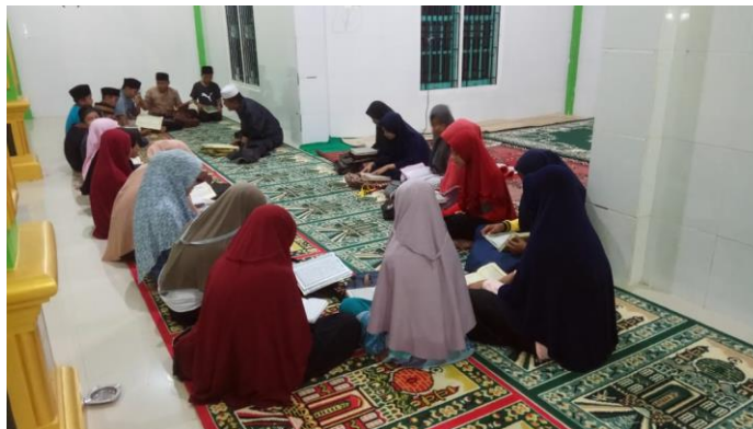
Gambar 3.1. Persiapan MTQ Kecamatan Sintuak Toboh Gadang

Sedangkan ketidakberhasilan pencapaian target dari indikator peringkat MTQ kecamatan, adalah dikarenakan adanya realokasi anggaran kecamatan yang digunakan untuk penanganan pandemi Covid 19 sehingga kegiatan MTQ yang seharusnya dilaksanakan oleh Kecamatan tidak dapat direalisasikan.