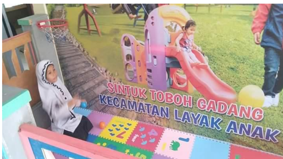
Gambar 3.4 Arena bermain anak-anak di ruang tunggu pelayanan Kantor Camat